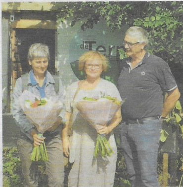
Moestuin De Terp, september 2018