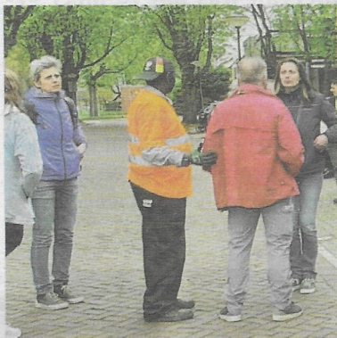
Opruimdag met mini-milieustraat, april 2022