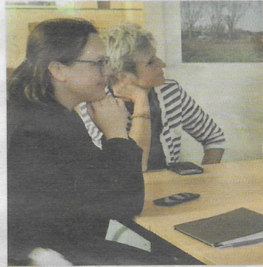
Wijkbijeenkomst groene buitenruimte, mei 2022